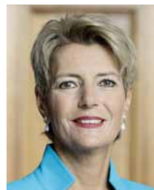
Karin Keller-Sutter, Präsidentin Ständerat Ehren-OK-Präsidentin TOPof19

Werden Sie Partner, sind auch Sie dabei am grossen 6-Tage-Fest „TOPof19“ in Lenggenwil.